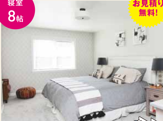
壁・天井のクロスリフォーム