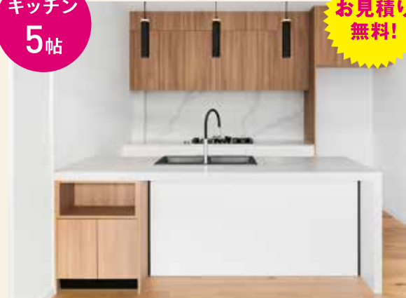
壁・天井のクロスリフォーム