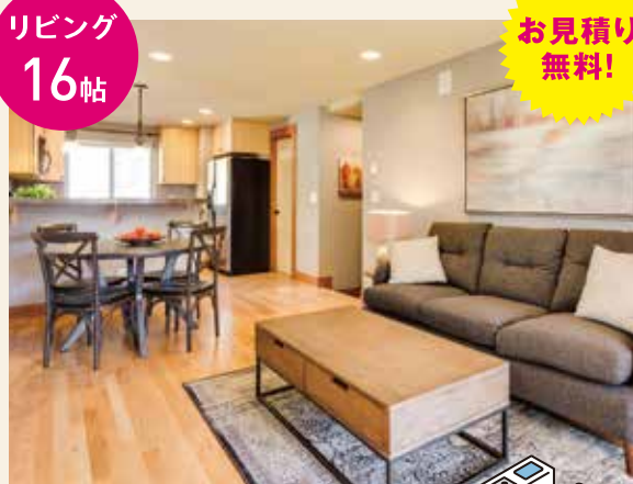
壁・天井のクロスリフォーム

実際どれくらいの費用がかかるの?そんな不安を少しは解消! 参考例を見て自分の家と見比べてみてください。おおよその費用感がわかります!